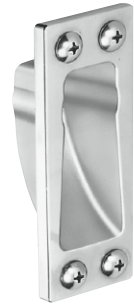
片開き用ストライク SKB型